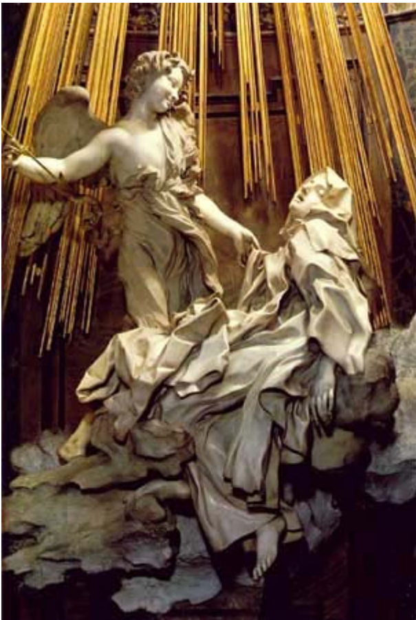
LÁMINA 3: G.L. Bernini. Éxtasis de Santa Teresa . 1644-1652. Mármol. Capilla Cornaro de Santa María Della Vittoria (Roma).