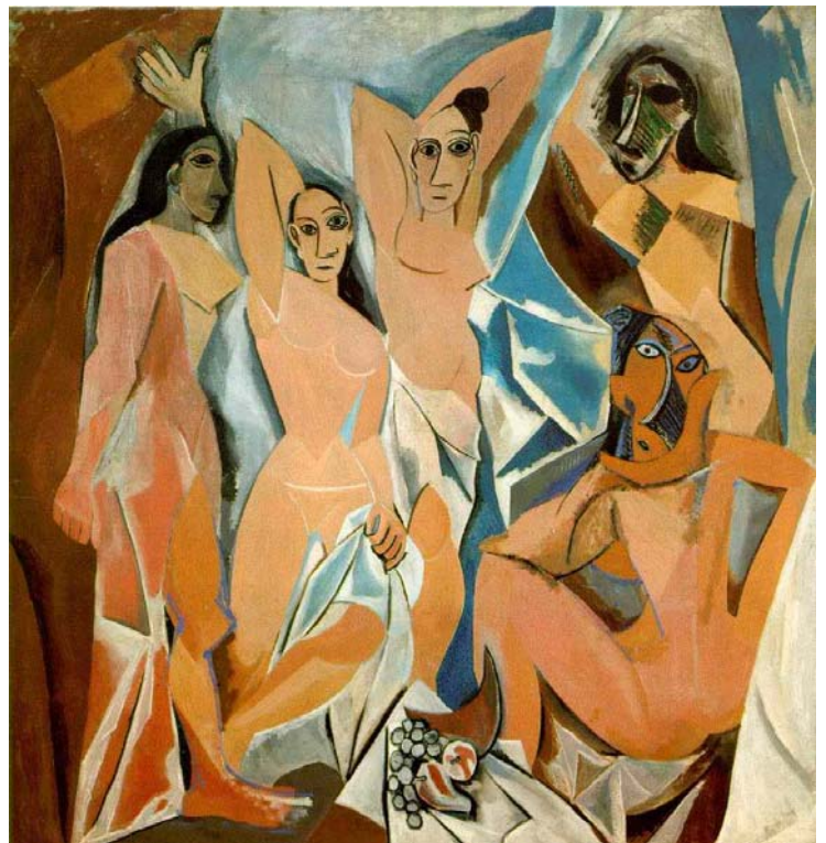
LÁMINA 4: P. Picasso. Les demoiselles d'Avignon . 1906-1907. Óleo sobre lienzo. 243x233 cm. The Museum of Modern Art (Nueva York)